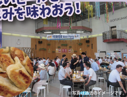
※写真は過去のイメージです。

※新型コロナウイルス感染症の拡大状況によっては中止や内容変更となる場合があります。